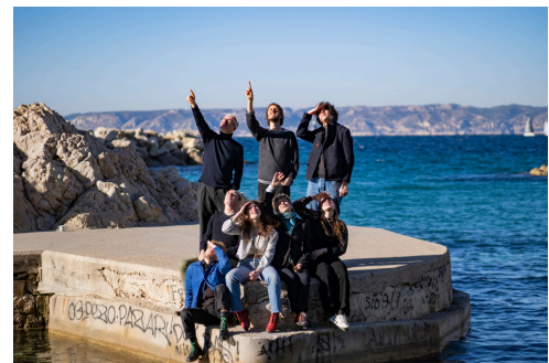
© Fella Bouziane et Olivier Quero